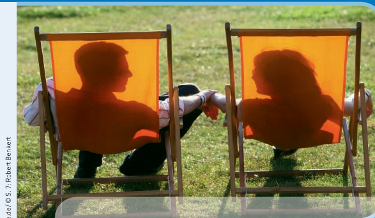
Gestaltung: Kippconcept gmbh, Bonn · © Tinei.J. Tack - Imagepoint.biz / © S. 3.ccm - photocase.de / © S. 7: Robert Benkert

FACHBEREICH PARTNERSCHAFT - EHE - FAMILIE - ALLEINERZIEHENDE